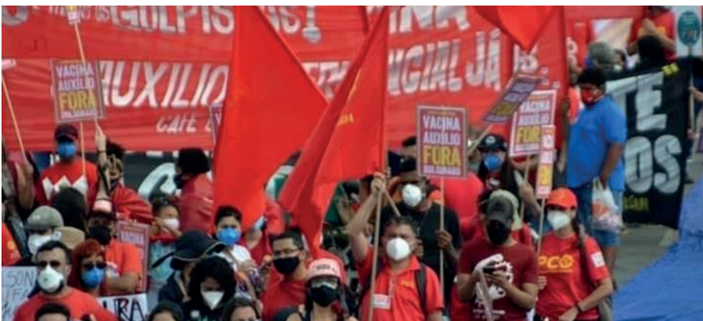
Legenda: Atos deverão ser ainda maiores do que dia 29.

E m reunião nessa quarta-feira (02), as principais organizações da esquerda decidiram marcar um novo ato nacional pelo Fora Bolsonaro, vacina para todos e auxílio emergencial.