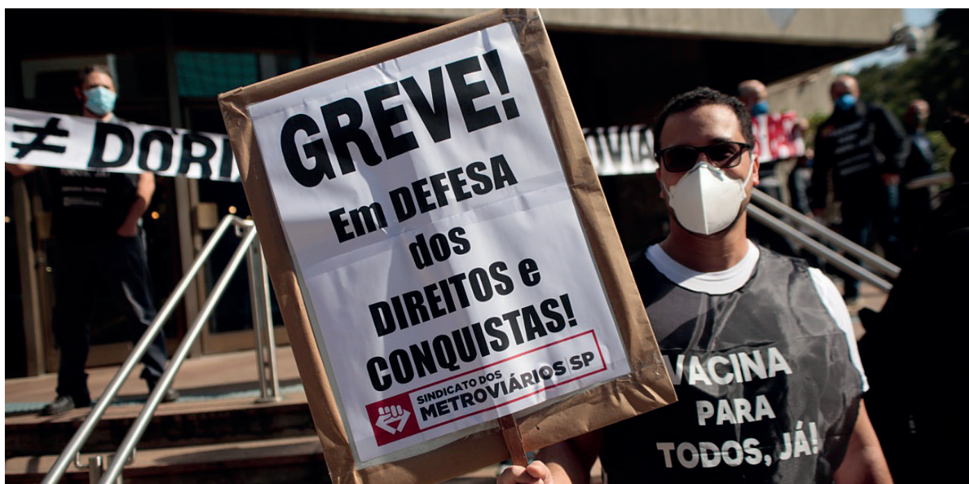
Reforçar a mobilização!

Os metroviários de São Paulo entraram em greve ontem (19) contra os ataques brutais do governador genocida João Doria (PSDB). Pedem reajuste salarial. Em audiência, o Ministério Público do Trabalho (MPT) propôs ao Metrô um reajuste de 9,7% em três parcelas, sendo duas somente no ano que vem - um golpe contra a categoria. Mesmo assim, a empresa controlada por Doria manteve a indecente proposta de reajuste de míseros 2,6%, não retroativo e só a partir de 2022. Um escárnio!